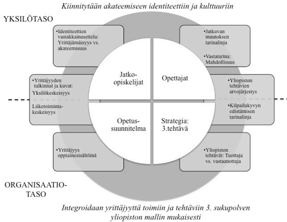
Kuvio 4: Yliopiston yrittäjämäisyyden rakentuminen eri näkökulmista