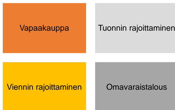
Kuvio 2 Kaupan vapauden aste valtiossa (mukauteltu Harisalo & Miettinen 2000, 51)

Yilmazin ja Flourisin (2017) mukaan poliittiset riskit voivat myös olla lähtöisin valtion asenteesta vapaata kauppaa kohtaan. Alla esitetty kuvio (kuvio 2) kuvastaa valtion asennetta globaalia taloutta kohtaan. Valtion asenne ulkomaankauppaa kohtaan voi olla liberaali, rajoittunut tai jotain näiden ääripäiden väliltä. Merkittävät asenteiden muutokset valtion päättäjien vaihtumisen seurauksena aiheuttavat poliittisen riskin tavaran vapaalle liikkuvuudelle. (Ekpenyong ja Umoren 2010)