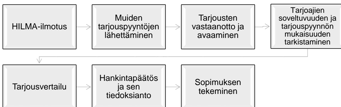
Kuvio 1. Avoin menettelyprosessi (Karinkanta et al. 2012, 70)

Avoimessa menettelyssä hankintayksikkö julkaisee hankinnasta HILMA-tietokanavassa hankintailmoituksen, ja tarjouskilpailuun halukkaat yritykset voivat ilmoituksen perusteella pyytää hankintayksiköltä tarjouspyyntöasiakirjat, tai ne ovat sähköisesti saatavilla (Pekkala & Pohjonen 2014, 228; Siikavirta 2015, 202; Karinkanta et al. 2012, 69). Tarjoajien löytymisen varmistamiseksi hankintayksikkö voi lisäksi lähettää tarjouspyyntöjä mahdollisille soveltuville tarjoajille, mutta tällöin on oltava tarkkana siitä, että mitään tarjoajaa ei suosita yli muiden (Siikavirta 2015, 202–203). Kaikkien tarjouspyyntöasiakirjojen tulee olla kaikkien halukkaiden tarjoajien saatavilla, eikä avoimessa menettelyssä saa karsia tarjoajia ennakoita, vaan tarjouksen lähettäneisiin tarjoajiin tulee soveltaa määriteltyjä soveltuvuusehtoja (Karinkanta et al. 2012, 69).