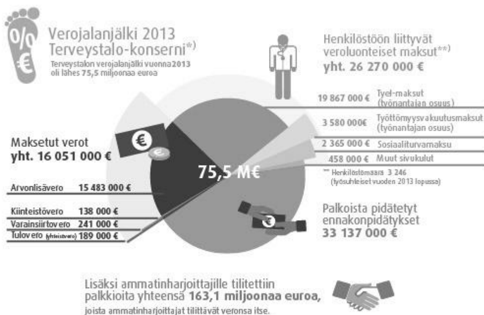
Kuvio 2. Terveystalon verojalanjälki 2013 (Terveystalo veronjalanjälki 2014)

Yritysvastuuraportointi olisi hyvä ottaa yrityksissä mukaan tuotantoketju-näkökulmaan, joka vastaisi useasti yrityksissä paremmin yritys vastuun vaikutuksia (Työsuojelurahasto 2013). Nykyisin on julkisuudessa paljon keskusteltu siitä, että pystyvätkö markkinat ratkaisemaan yritysten sosiaaliset ja ympäristöongelmat. Markkinat pystyvät parantamaan yritysten sosiaalista ja ympäristösuorituskykyä, jos asiakkaat, työntekijät, sijoittajat ja muut sidosryhmät pystyvät vaikuttamaan siihen, onko yritys yritys vastuussa hyvällä vai huonolla tasolla. Ulkopuolisten on pystyttävä vaatimaan hyvää yritys vastuuta. Yrityksistä täytyy kuitenkin saada tietoa siten, että pystytään erottelemaan hyvät ja huonot yritys vastuun tekijät. (Utgärd, 2015, 12)