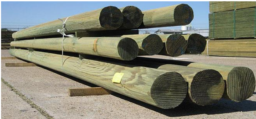
Kuva 2 Esimerkki CCA-kyllästetyistä puupylväistä (NPIC 2014.)

CCA-kyllästetty puu voidaan lisäksi luokitella käytöstä poistetun puumateriaalin eli kierrätyspuun luokkien mukaan A, B, C tai D VTT:n ohjeistuksen perusteella. Luokan A ja B puu kuuluvat puuperäisten biopolttoaineiden standardin SFS-EN ISO 177225-1 alle, missä A on puhdasta puumateriaalia ja luokka B kemiallisesti käsiteltyä puuta, joka ei sisällä orgaanisia halogenoituja yhdisteitä tai raskasmetalleja. Luokkaan C kuuluu orgaanisia halogenoituja yhdisteitä ja raskasmetalleja sisältävä puu, joka ei sisällä puunkyllästeaineita. C-luokan puun laatuvaatimukset määritellään kierrätyspolttoaineiden standardin SFS-EN 15359 sisällä. CCA-kyllästetyt sähköpylväät taas kuuluvat puunkyllästysaineilla käsitellynä puuna luokkaan D, joka on vaarallista jätettä. Esimerkin CCA-kyllästeillä käsitellyistä vihertävistä puupylväistä voi nähdä kuvassa 2. (VTT 2014.)