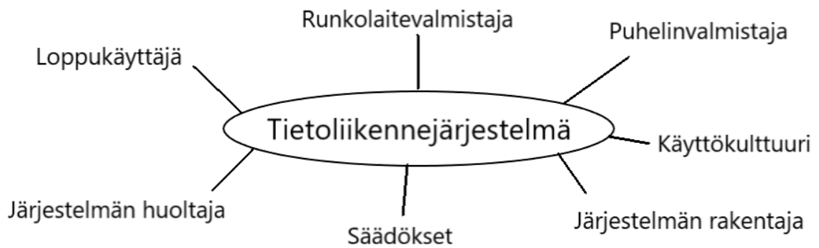
Kuva 1. Tietoliikennejärjestelmän sosio-tekniinen periaatekuva, mukailten Geels.

Usein on tarpeellista, että samaa yhteiskunnan muutosta edesauttamaan tulee useita niche-innovaatioita. Esimerkiksi 1800-luvun lopussa hevöskäyttöisten vankkureiden tilalle tuli samanaikaisesti polkupyörä, sähköauto, höyrykonekäyttöinen auto ja polttomoottoriauto. Polkupyörien yleistymisen johti nopeasti vaatimuksiin teiden parantamiseksi. Teiden parantaminen ja laajentaminen koitui myöhemmin polttomoottoriautojen eduksi. Samaan aikaan tapahtui myös keskustojen ja lähiöiden syntyminen, joka mahdollisti sähkökäyttöisten raitiovaunujen käyttöönoton. Tämä edellytti tietysti myös teiden leventämistä, tieverkoston laajentamista ja teiden laadun parantamista ylipäättään. Geels (2004, 688-692.) on kuvannut tätä prosessia paljon yksityiskohtaisemmin.