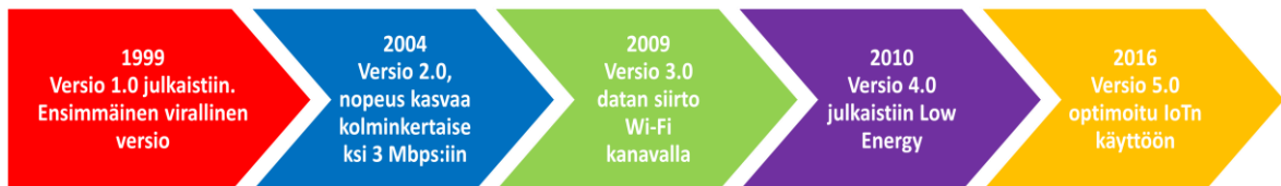
Kuva 2 Bluetoothin versioiden aikajana

Seuraavissa alakappaleissa käsitellään Bluetoothin eri versioita. Kappaleissa käydään läpi vain merkittävimmät muutokset vanhemmista versioista. Bluetooth laitteisto on täysin yhteensopiva aiempien Bluetooth-versioiden kanssa. Näin ollen esimerkiksi Bluetooth 5.2 laitteet toimivat saumattomasti ainakin teoriassa [11] vanhempien Bluetooth 4.2 laitteiden kanssa. Yleisesti ottaen uusi versio on tuonut muutoksia käytettäviin algoritmeihin ja tuettuihin ominaisuuksiin.