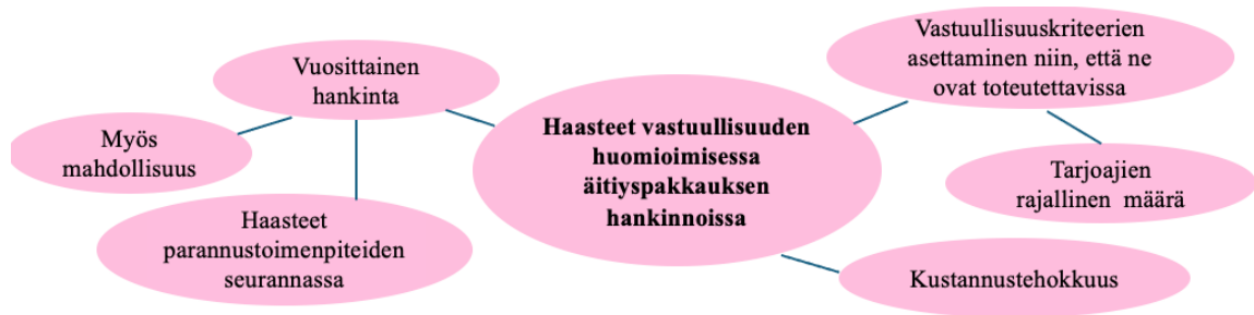
Kuva 3. Haasteet vastuullisuuden huomioimisessa äitiyspakkauksen hankinnoissa

Lempiäisen mukaan vastuullisuuteen liittyvien vaatimusten asettaminen niin, että ne ovat tarjoajien toteutettavissa, on myös haaste. Asetettavat vastuullisuuskriteerit eivät voi olla liian tiukkoja, haastavasti toteutettavia tai kalliita, sillä tarjoajia on rajallinen määrä. Mikäli vaatimukset eivät ole täytettävissä, saattaa se johtaa kyseisen tuoteryhmän toteutumatta jäämiseen. Juuri markkinavuoropuhelulla pyritäänkin ehkäisemään tällaisen tilanteen syntymistä. Keskustelemalla tarjoajien kanssa tulevista vastuullisuusvaatimuksista voidaan varmistua siitä, että ne pystytään toteuttamaan. (Liite 1)