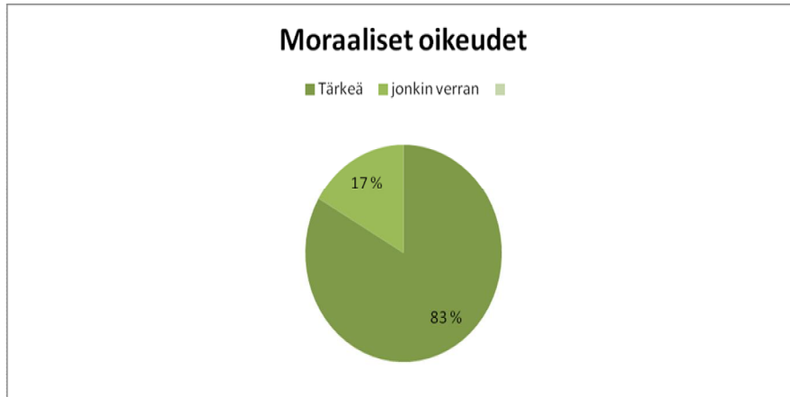
Taulukko 2: Moraaliset oikeudet (kysymys 1e): Säännöstä keskeisenä pitäneiden prosenttiosuudet tärkeydestä.

Moraalisten oikeuksien loukkaamisesta on kyse korkeimman oikeuden ratkaisussa (KKO 2005:92), jonka mukaan levy-yhtiö ei olisi saanut käyttää vanhojen alkuperäislevyjen valmistamissa taitelijan käyttämää uutta nimeä. Asiasta ei ollut sovittu osapuolten kesken. Käyttöön olisi tarvittu tekijän lupa, joten menettely rikkoi taiteilijan isyysoikeutta.